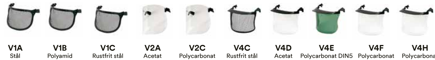
V1A Stål V1B Polyamid V1C Rustfrit stål V2A Acetat V2C Polycarbonat V4C Rustfrit stål V4D Acetat V4E Polycarbonat DIN5 V4F Polycarbonat V4H Polycarbonat